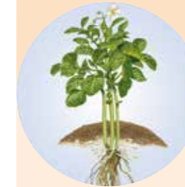
INÍCIO DA FLORAÇÃO