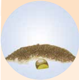
SEMENTEIRA OU PÓS-SEMENTEIRA