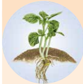
15 DIAS APÓS EMERGÊNCIA